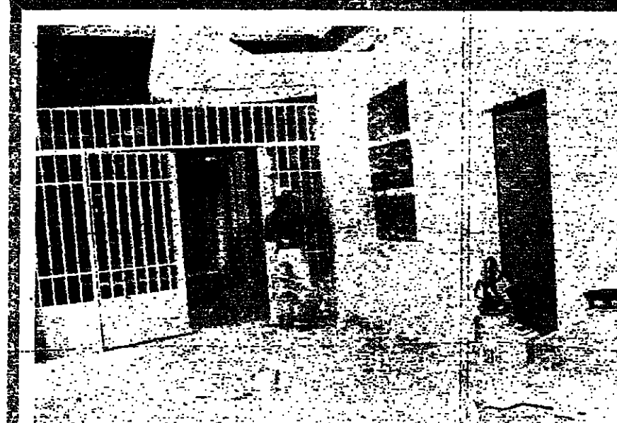
مقر وزارة الداخلية كما يبدو من الداخل بعد ترميمه